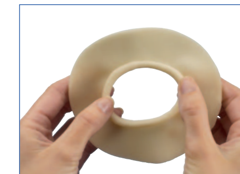
6 ...eller modeller hullet i midten for at få en tykkere kant.