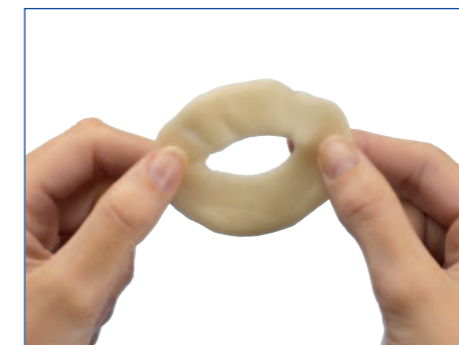
2 Modeller ringen efter dit behov.