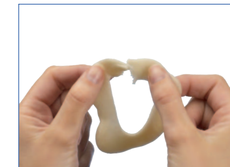
3 Kan let rives over og sættes sammen igen - hvis nødvendigt...