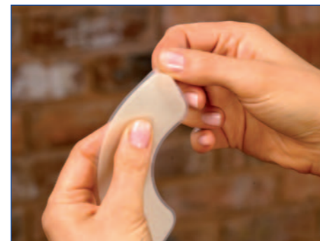
1 Fjern beskyttelsesfilmen.