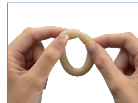
5 ...for at lave en tykkere tætningsring...