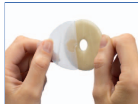
1 Fjern beskyttelsesfilmen på begge sider af tætningsringen.

"Disse tætningsringe har forhindret lækage og gør at jeg kan bære min pose i længere tid"